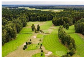
/Golfa klubs Viesturi/