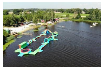
/Mārupes veikparks, pludmale/