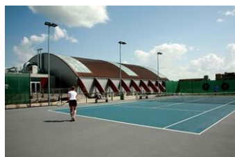
/Tenisa klubs ACB/